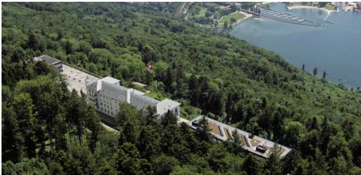
C'est à Macolin que s'est tenue, selon la tradition, l'assemblée générale 2007 de l'ASPT.