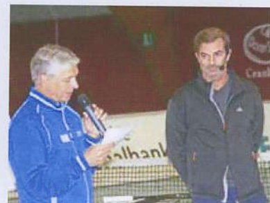
Forum 2009 mit Ferrero Academy Kriens