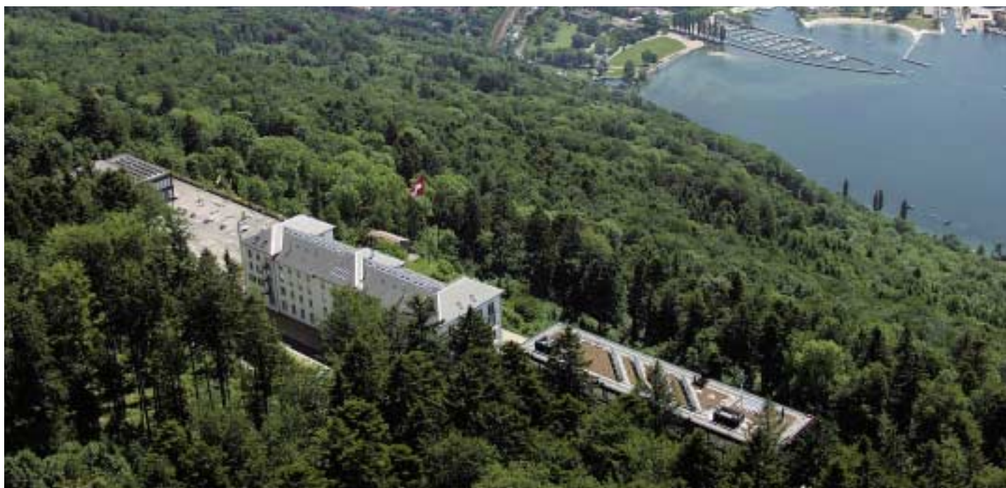
Magglingen war traditionsgemäss auch 2007 Austragungsort der TVS-Generalversammlung.